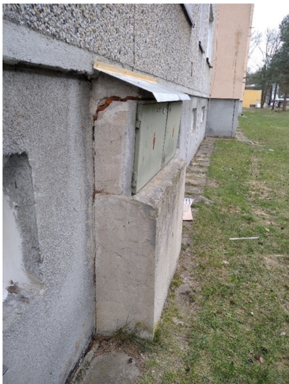
Obrázek 14 - Defekt pojistkové skříně ve vlastnictví ČEZ Distribuce, a.s.