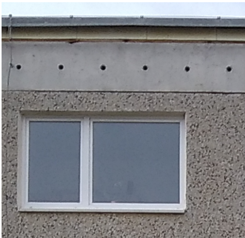
Obrázek 4 – Stávající větrací otvory střechy v atikovém panelu