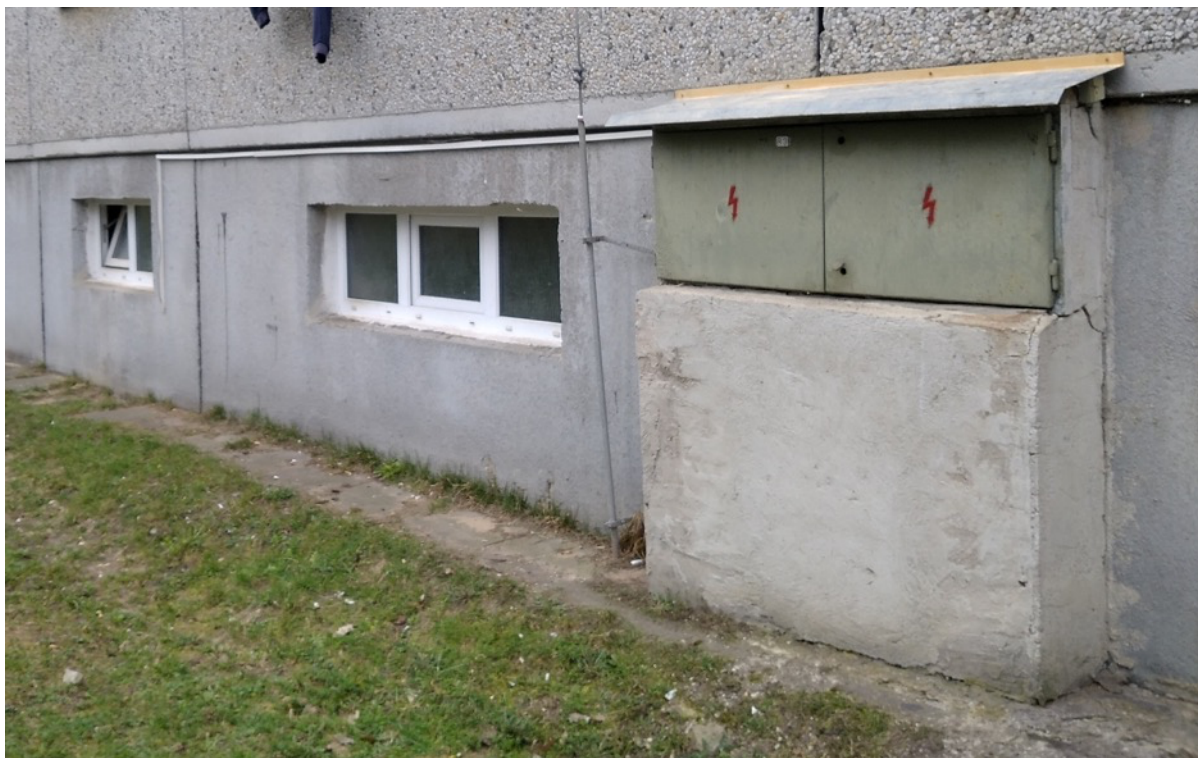
Obrázek 1- Popraskaná obezdívka rozváděče se stávajícím teplotním čidlem a vedením signálu do kotelny