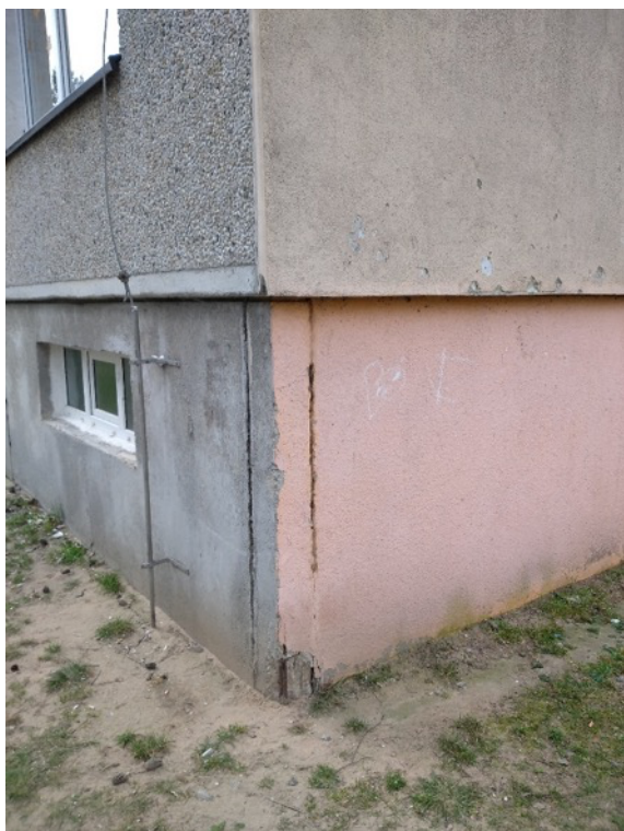
Obrázek 7 - Koroze výztuže v nároží