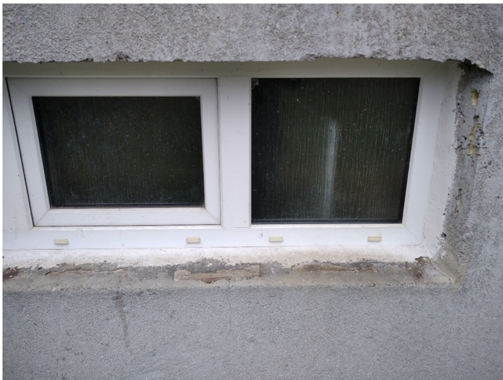
Obrázek 6 - Dřevěné špalíky parapetu a nepřesnost ostění