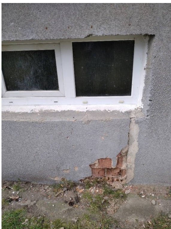
Obrázek 5 - Narušená dozdivka parapetu z děrových cihel