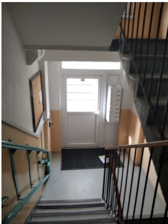
Obrázek 10 – Vchod do domu