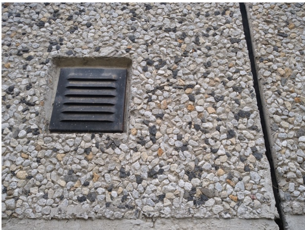
Obrázek 3 - Stávající větrací mřížka spíše v obvodovém panelu