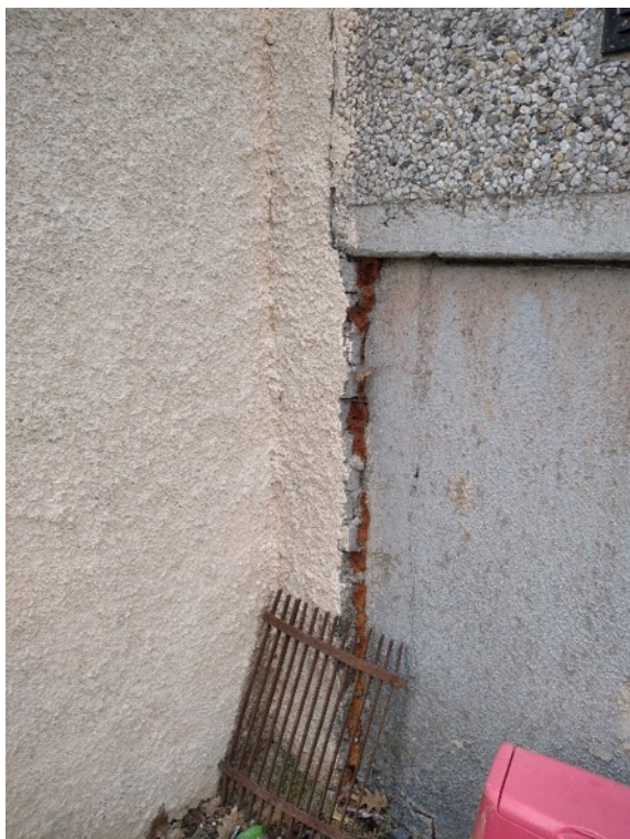
Obrázek 2 - Napojení dílny na sokl bytového domu