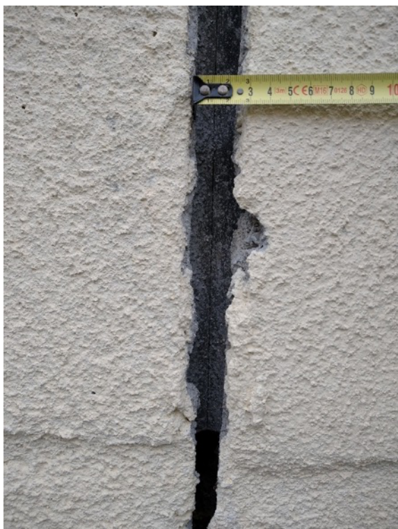
Obrázek 13 - Spára mezi obvodovými panely