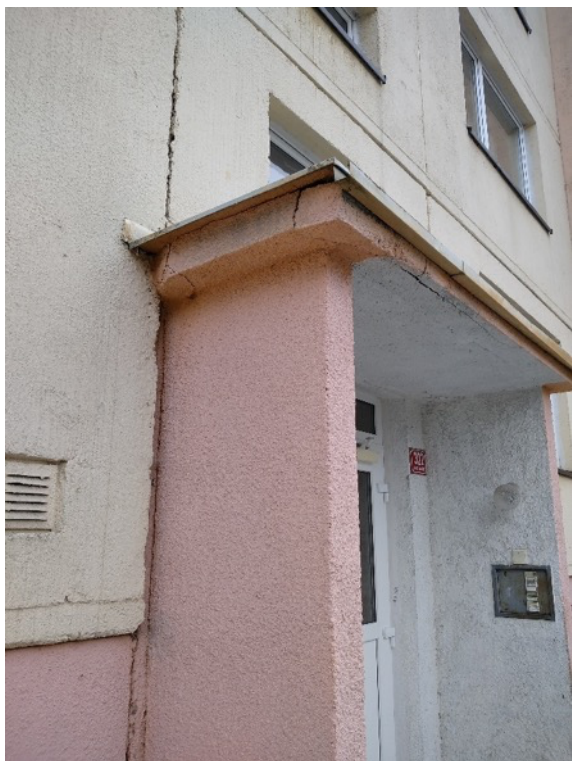
Obrázek 12 – Trhliny ve stávajícím stropním panelu vstupu