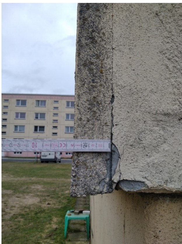
Obrázek 9 – Stávající KZS štítu narušený biologickými činiteli