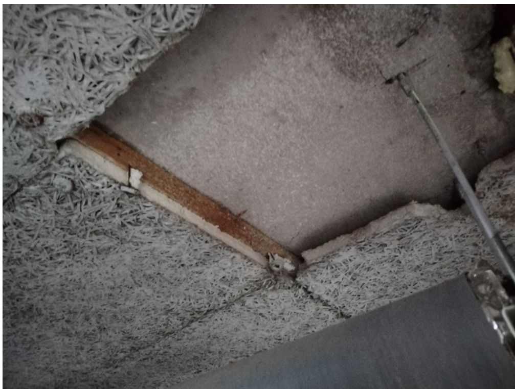
Obrázek 15 - Stávající dřevěný rošt se zateplením stropu nad 1.PP