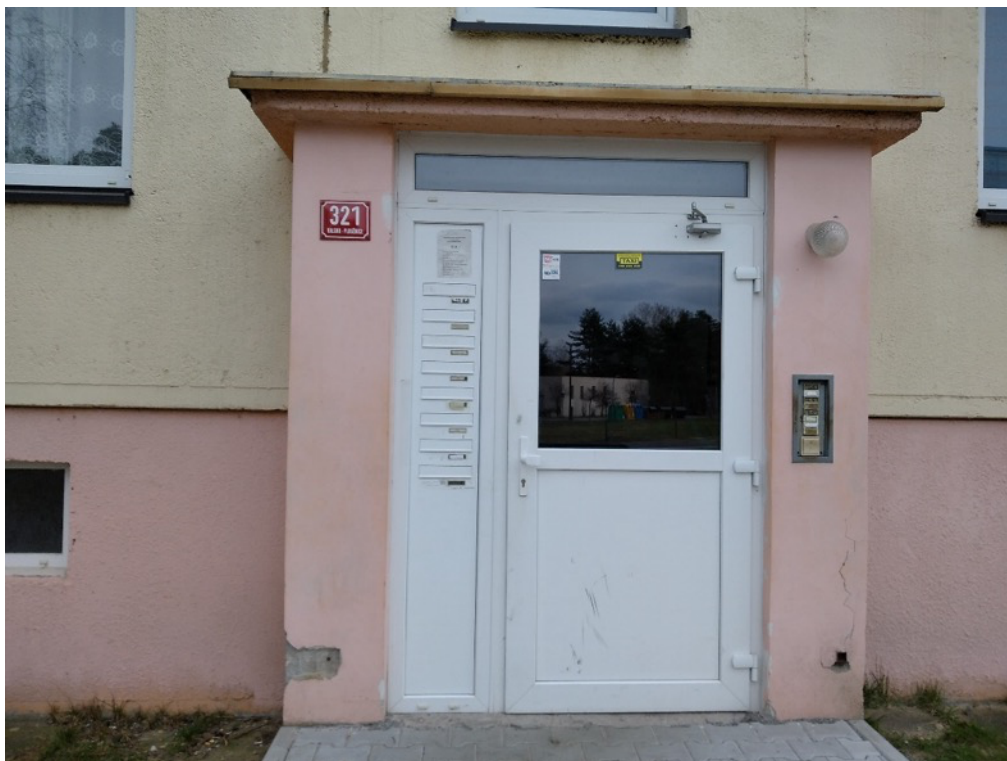
Obrázek 8 - Stávající narušená dozdvívka vstupu